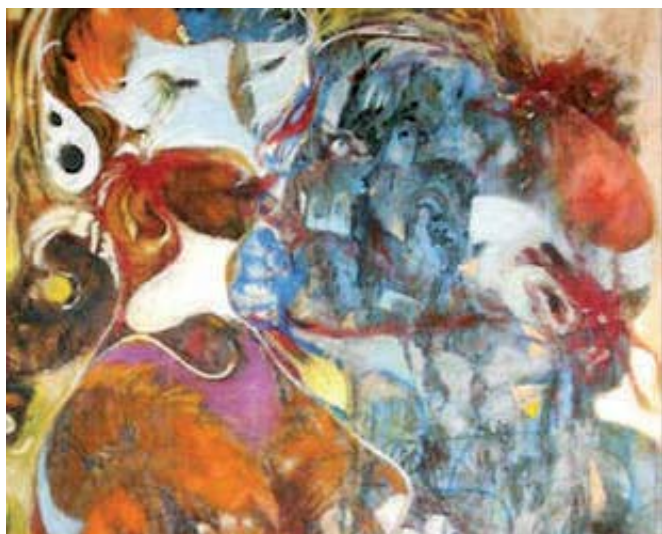
Calderón de la Torre